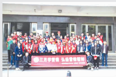
学生志愿者合影留念