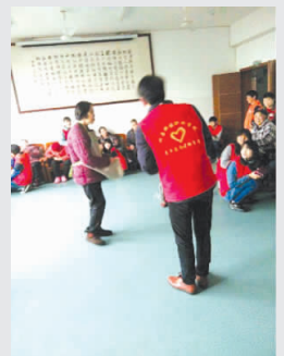
学生在社区开展活动