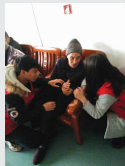
学生与敬老院老人在一起

今年3月5日是第54个学雷锋日。为了传承雷锋精神，学校各院系纷纷发起活动，组织学生行动起来，深入到敬老院、社区、街道做义工，把爱心献给身边的人，让世界充满爱。（罗金星 供稿）