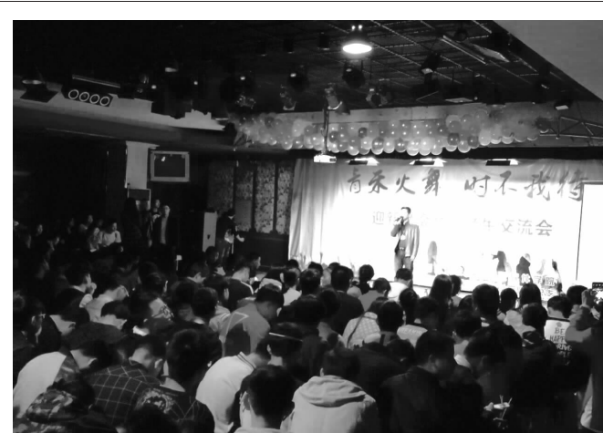
10月26日，软件学院举办的“春禾火舞 时不我待”迎新晚会暨新老生交流会在雨花校区音乐系综八教室举行。活动以歌舞表演为主，全场气氛热烈，特别是优秀学长的讲话催人奋进。此次活动让新老同学之间有了进一步的了解，让学院更具凝聚力。图为获得国家奖学金的学长在台上发言。